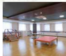
リハビリテーションルーム